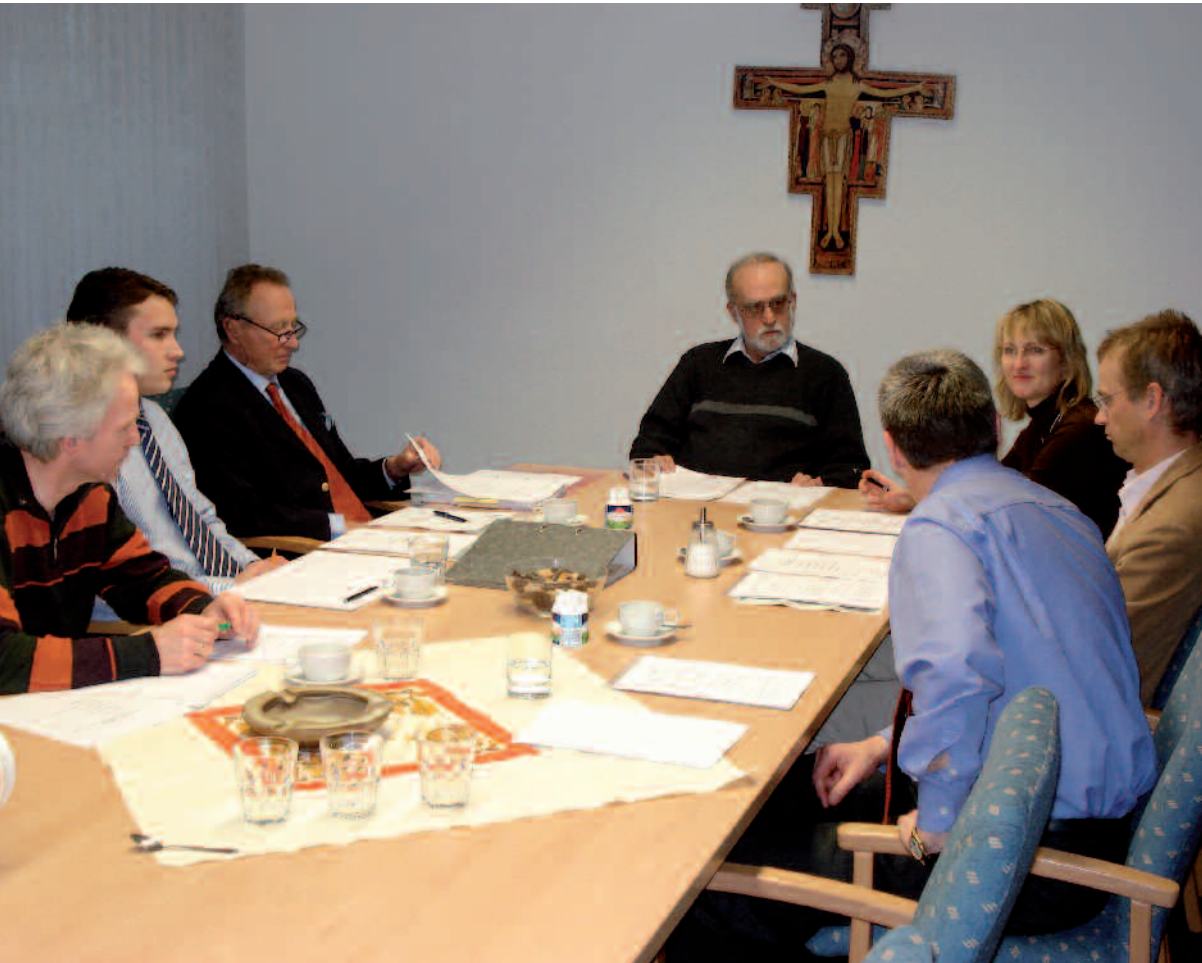
Sitzung des Kuratoriums der Dres Schill Stiftung Die Stiftung fördert Bildungs- und Ausbildungsprojekte in Afrika.